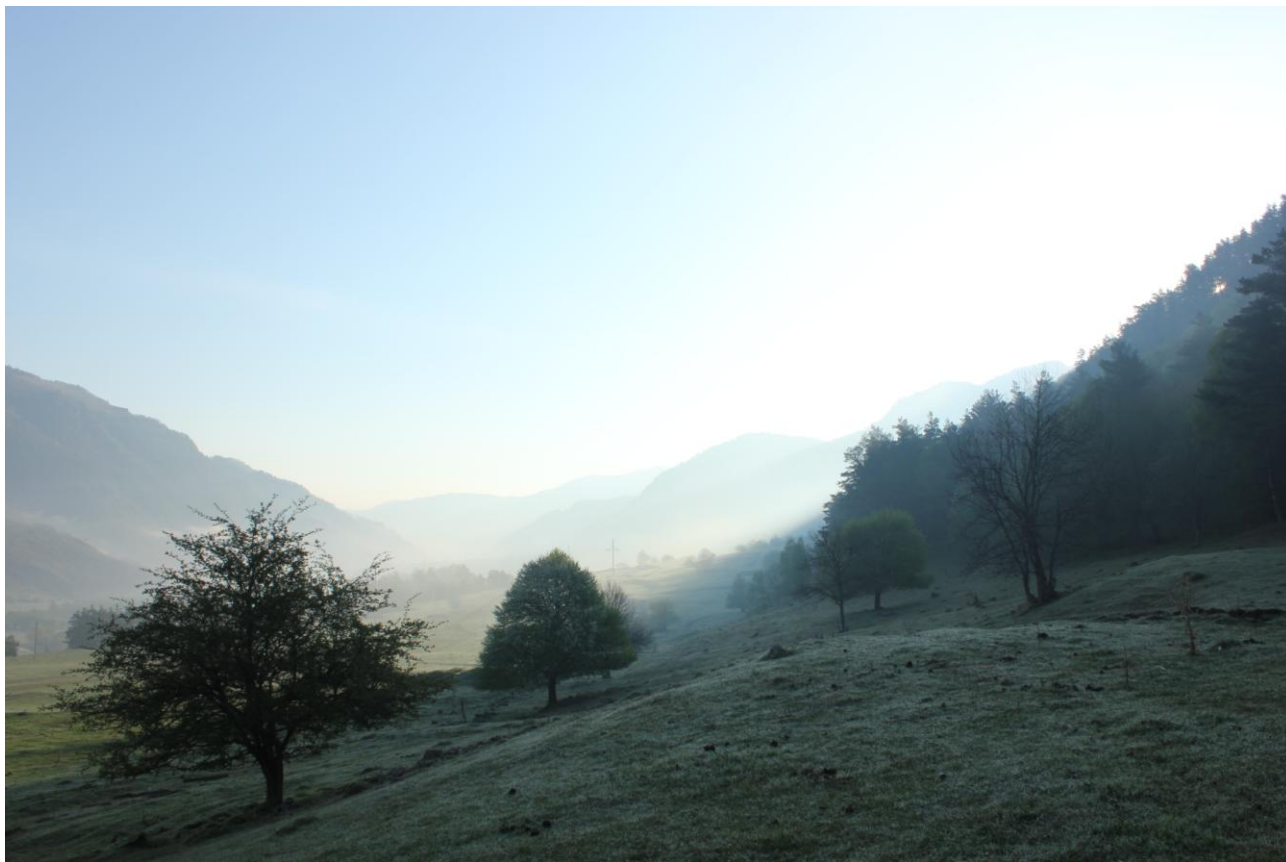
Фото 15. Холодное утро на р.Теберда, иней

Далее сплавились до приличного места стоянки на левом берегу, не доходя около 10 км. до Гай-порога и, соответственно г.Карачаевск.