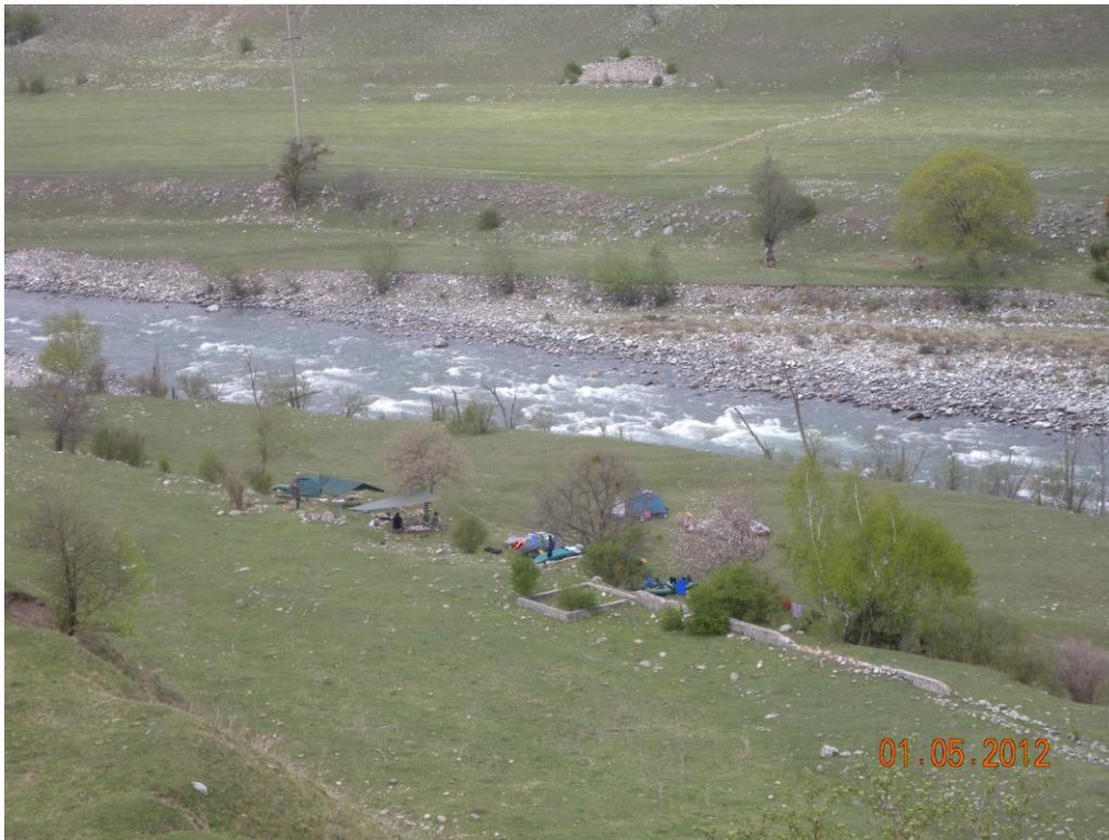
Фото 11. Лагерь