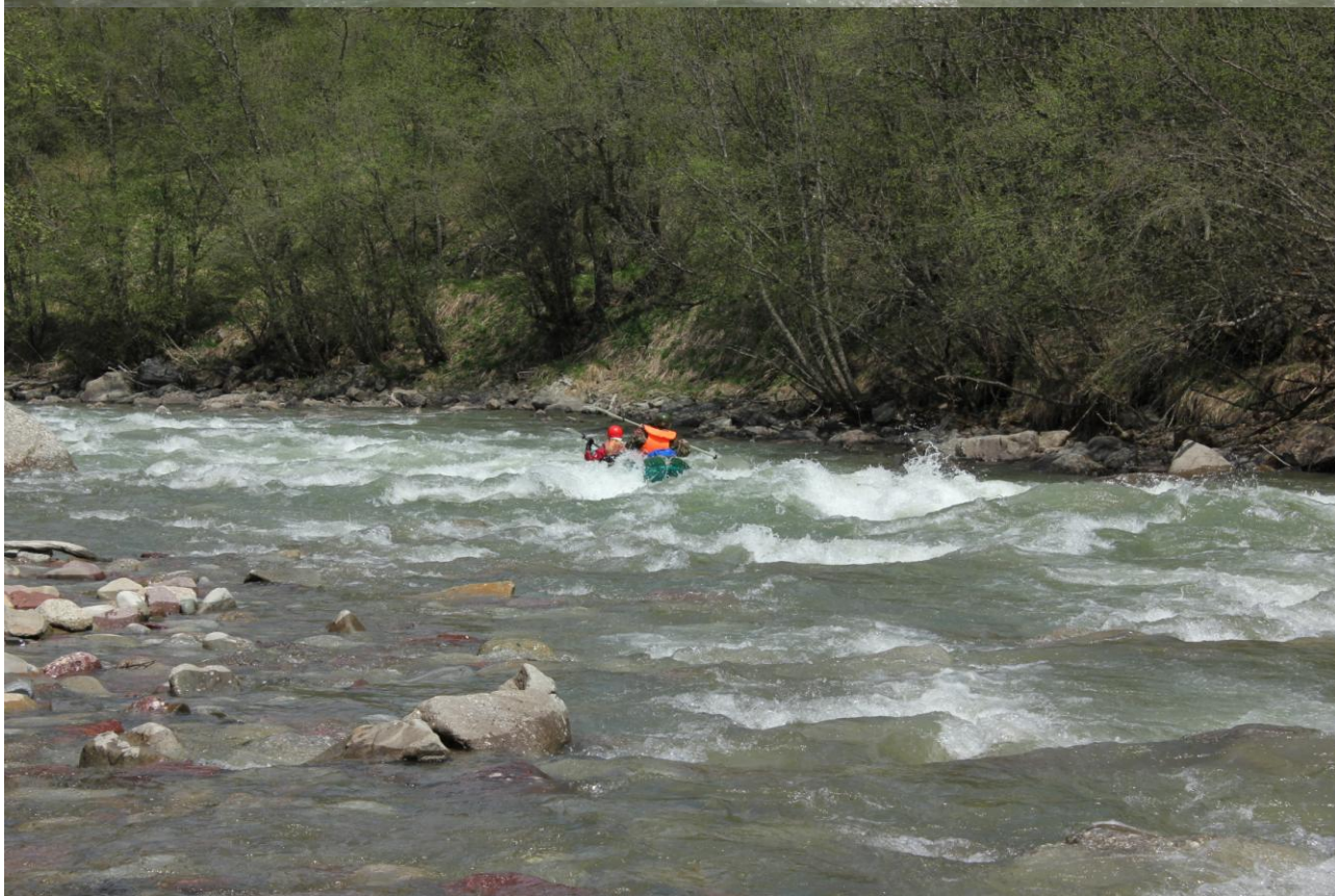
Фото 39, 40, 41. Прохождение п.Мустанг, Антон, Светлана.