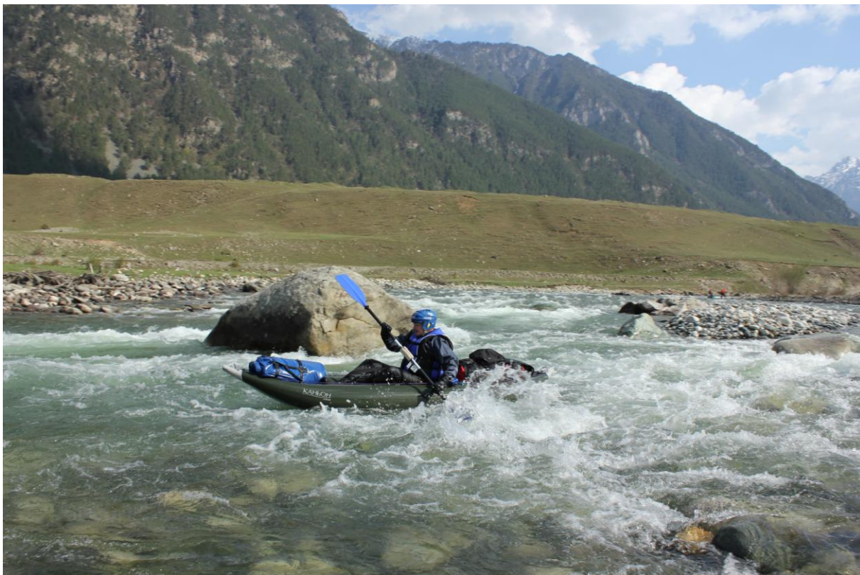
Фото 5, 6. «Лунный Камень», Сергей, Каньон Соло.