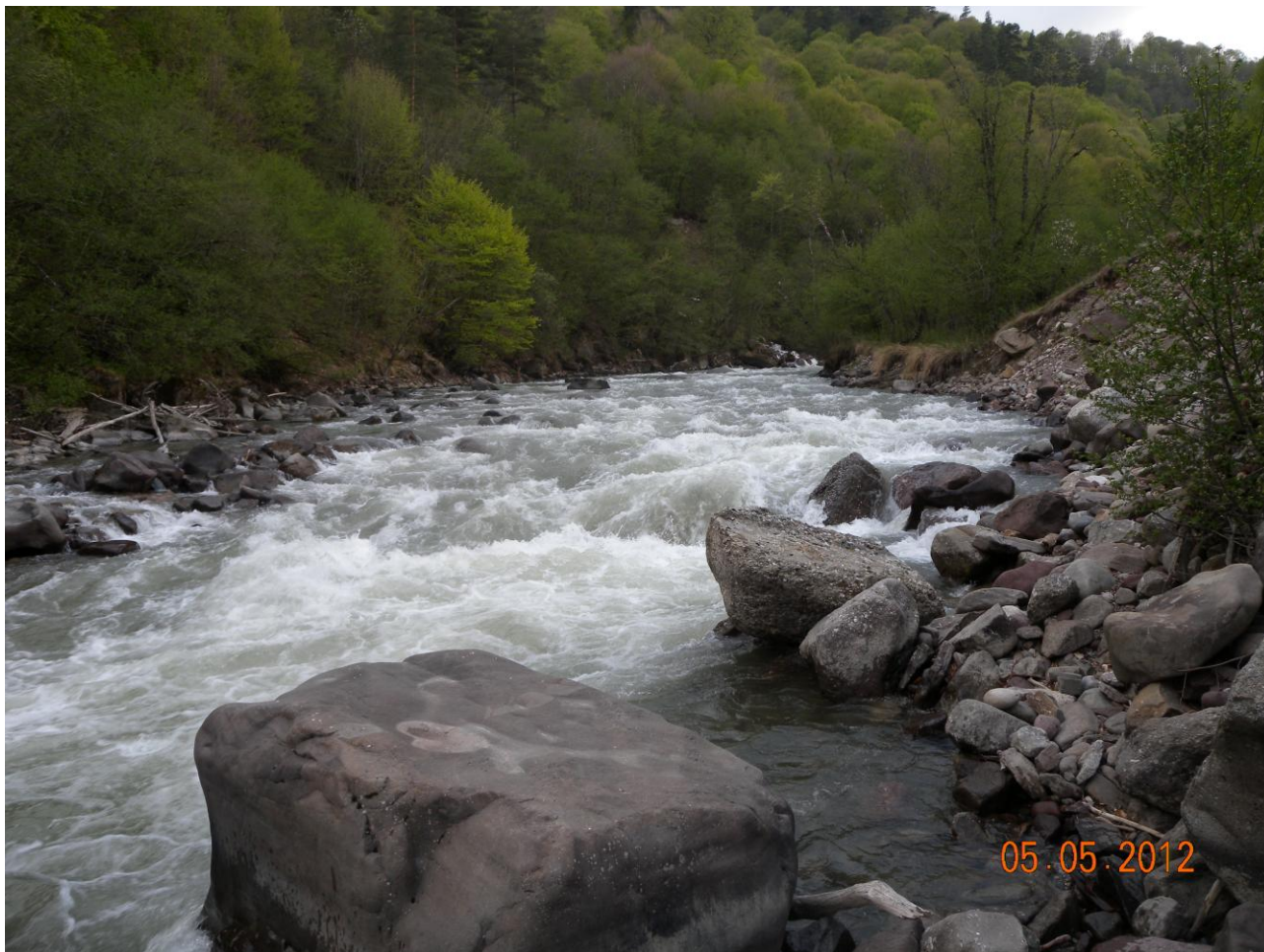
Фото 42-46. Каньон «Осыпной»