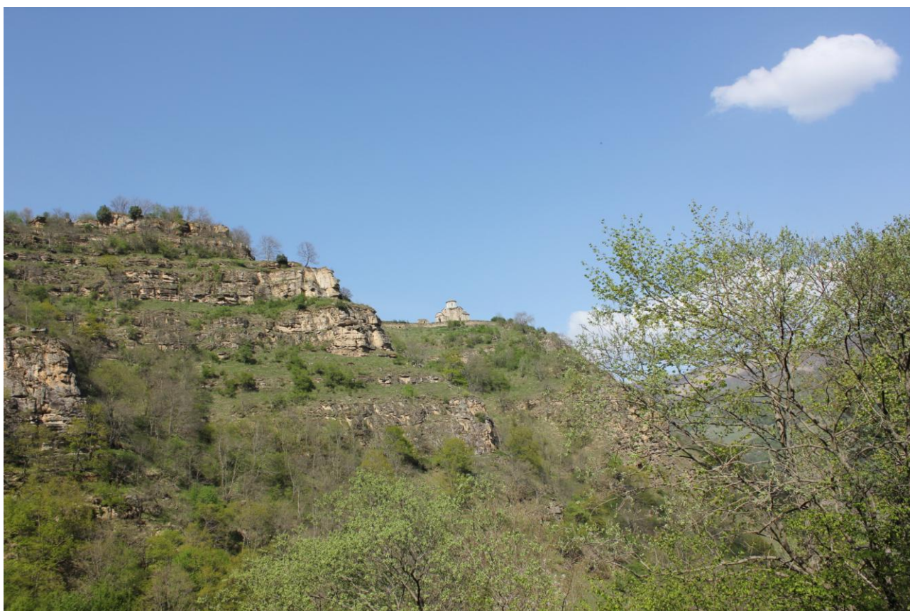
Фото 16, 17, 18. Сентинский храм X века