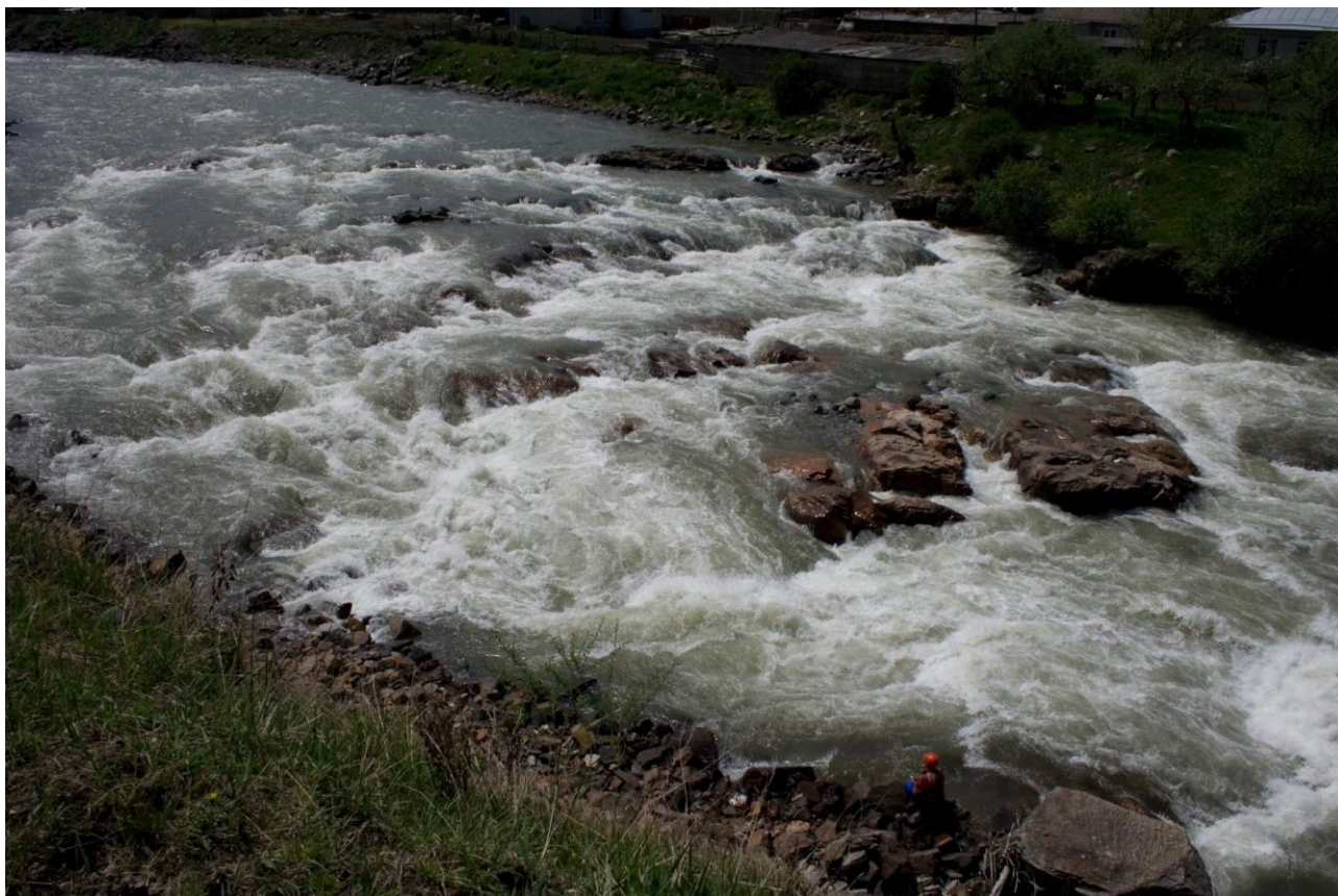
Фото 20. Гай порог

необходимо зачалиться для просмотра порога и организации страховки. Еще на подходе виден навесной мост. На левом берегу расположен карачаевский аул Джингирик. Порог имеет общее падение около 4-х метров и длину около 80-ти метров. Начинается он от галечной отмели и заканчивается за навесным мостом. В центре русла остров образованный грудой камней. Слева и справа от острова протоки. Левая протока более короткая и прямая, но в ней маловато воды, проход возможен, но есть вероятность повредить судно. В правой камней нет, но есть четыре бочки расположенные одна за другой с небольшими интервалами. Ниже 20 метров ровного, но сильного течения до моста. За мостом улова по обоим берегам. Дальше за мостом начинается не сильная шивера. Выставили морковку и фото.