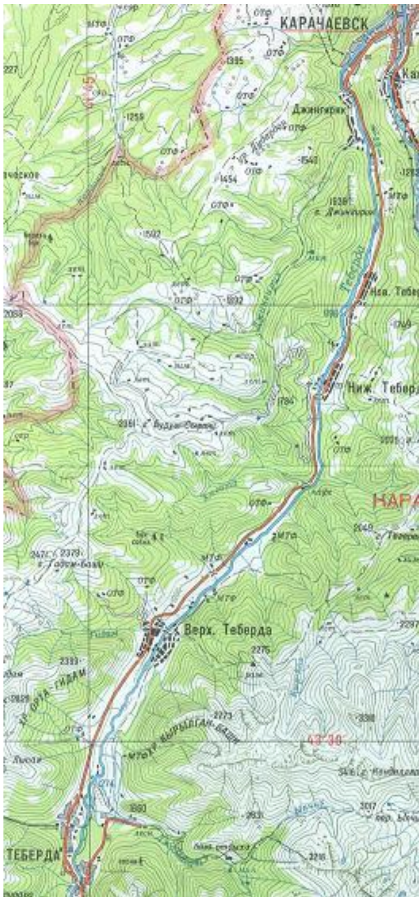
Рис. 1. р.Теберда