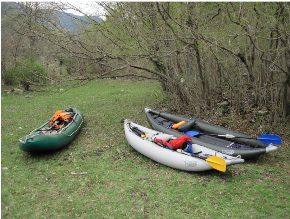
Фото 1. Готовые лодки. Слева направо: Лукна, Спорт, Соло.