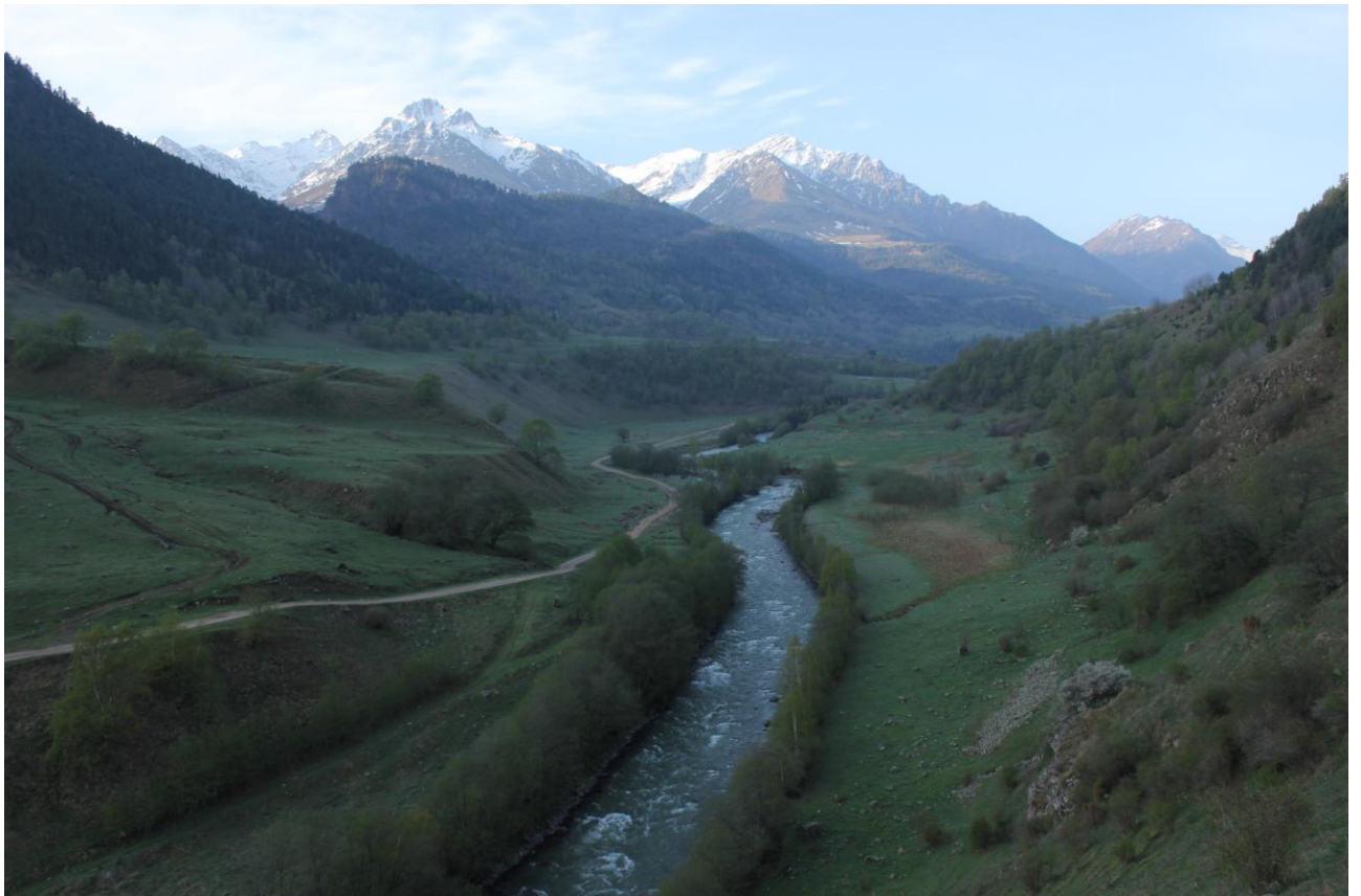
Фото 32. Вид на долину р.Аксаут.