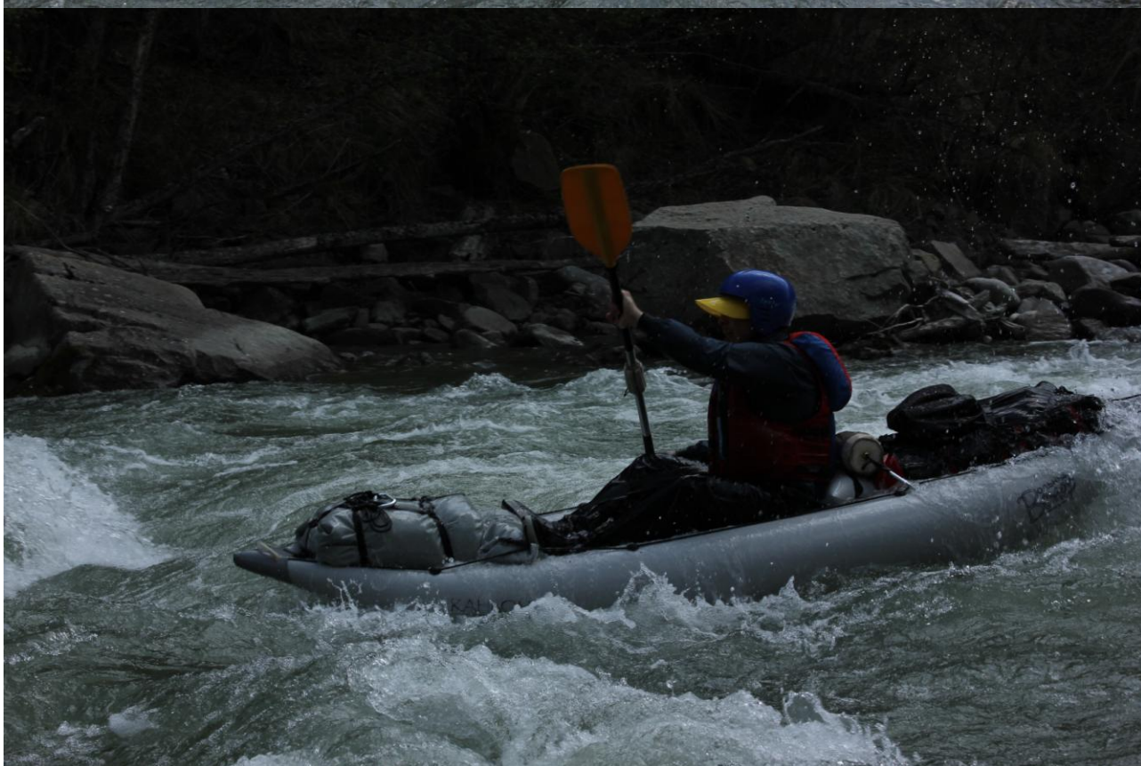
Фото 33, 34, 35. Прохождение п.Мустанг, Федор.