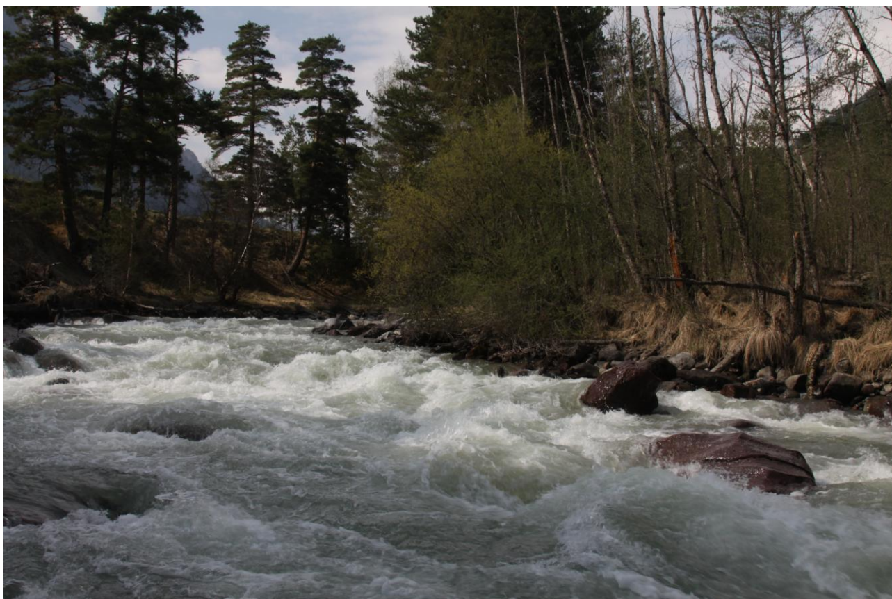
Фото 28. р.Аксаут на месте стапеля