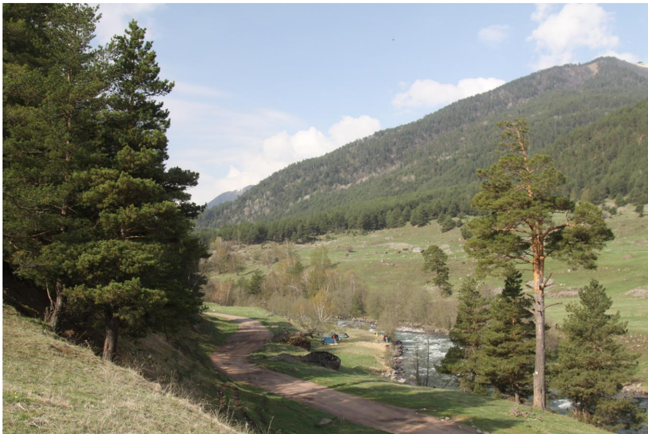
Фото 27. Стоянка на месте стапеля на р.Аксаут.