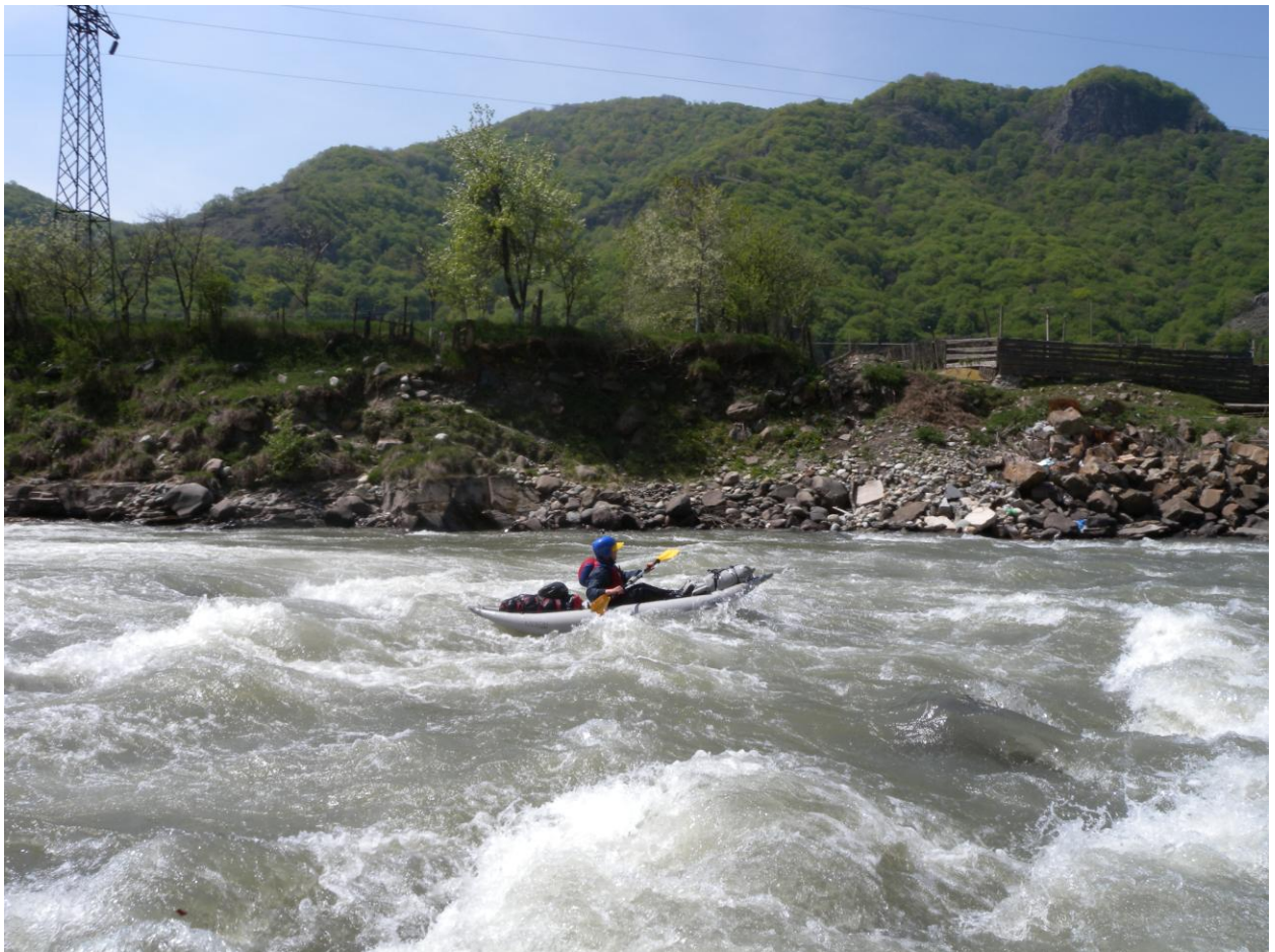
Фото 21, 22, 23. Прохождение Федора.