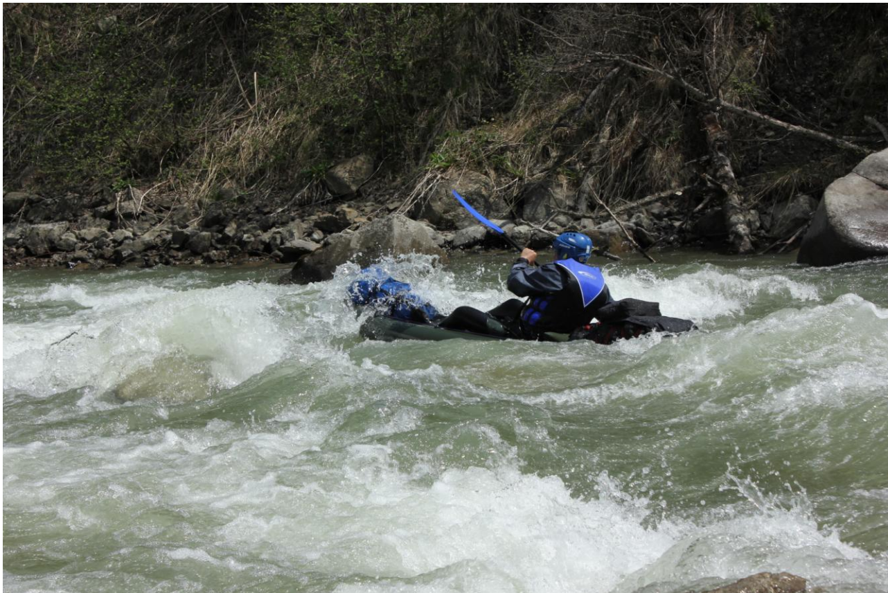
Фото 36, 37, 38. Прохождение п.Мустанг, Сергей.