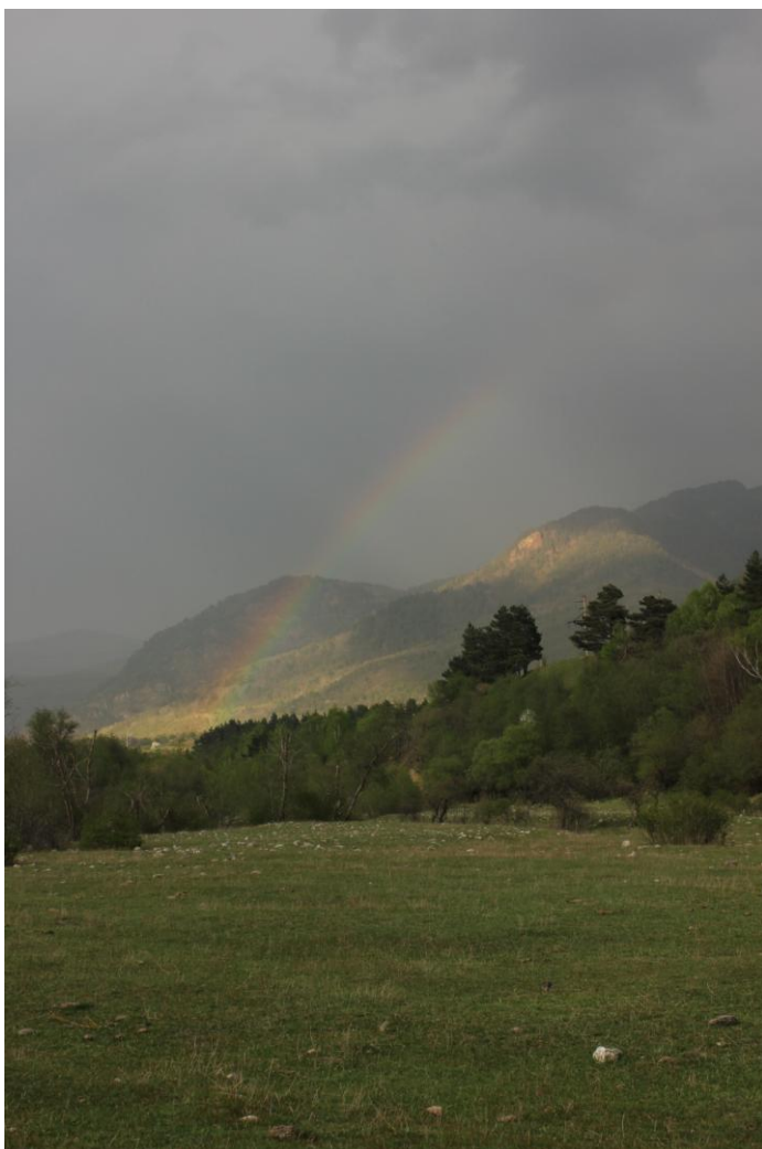
Фото 12. Радуга