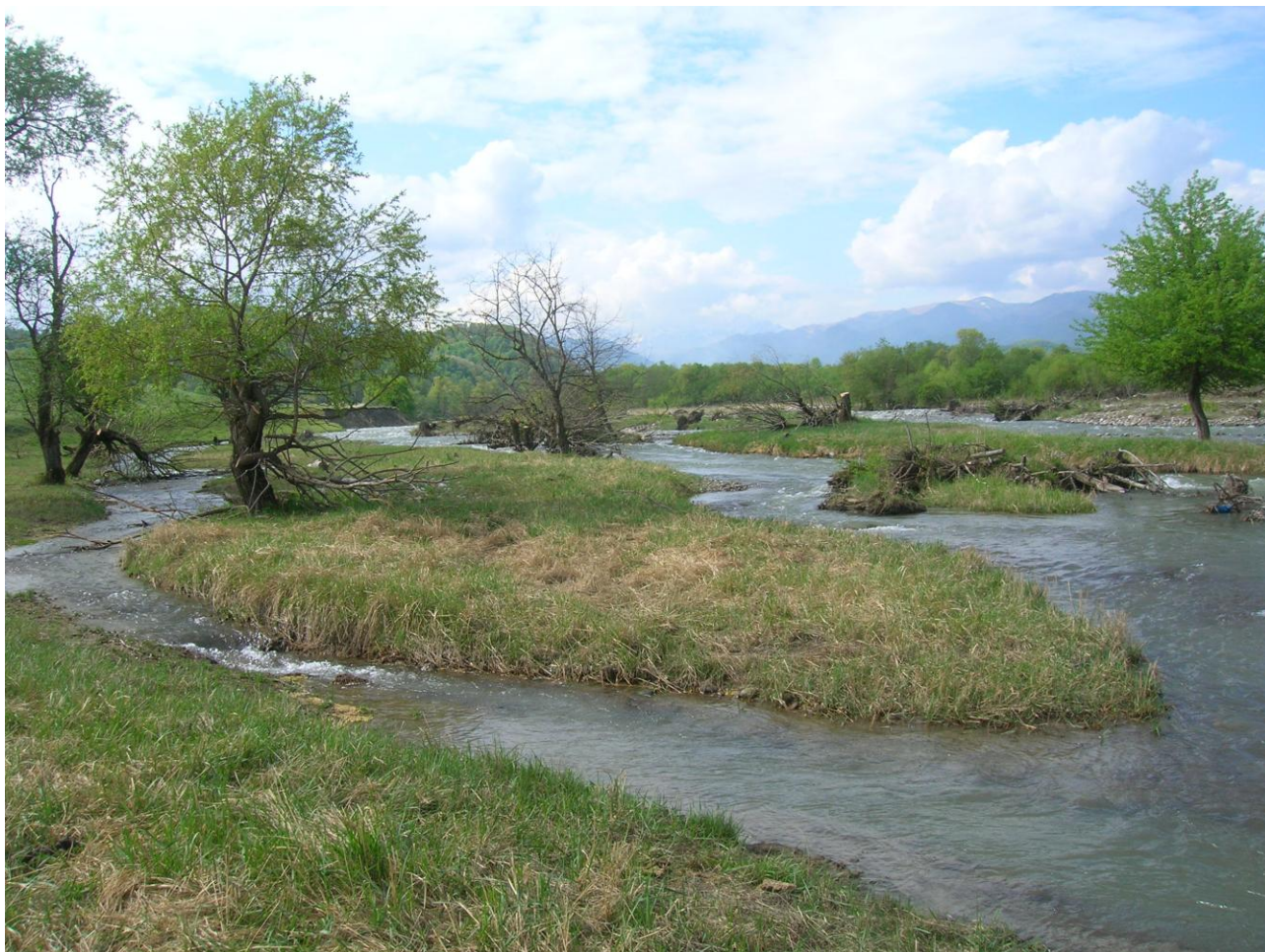
Фото 48. Вид на р.Аксаут с последней стоянки