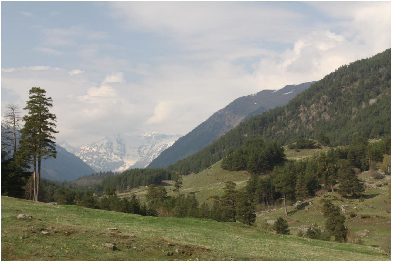
Фото 29. Долина р.Аксаут на месте стапеля