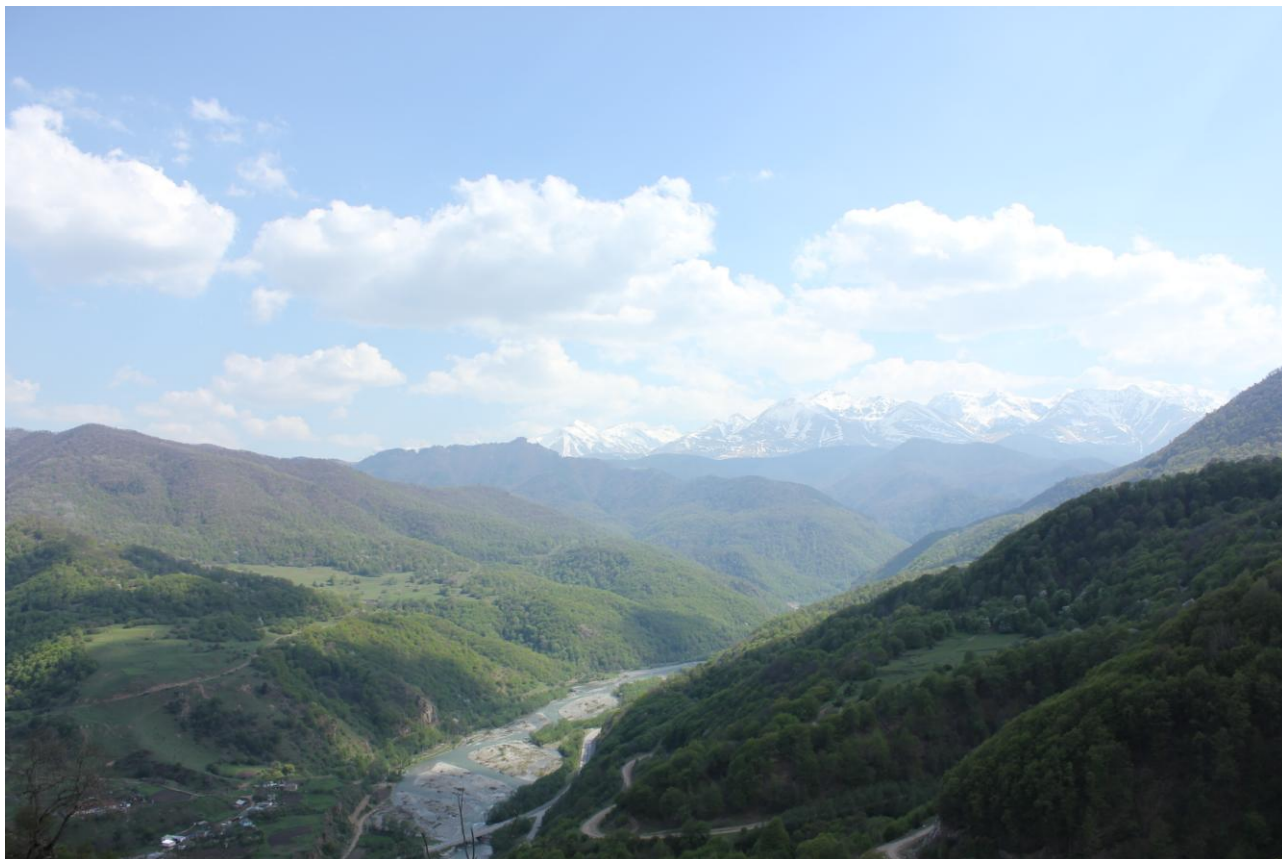
Фото 19. Долина р.Теберда, разбои