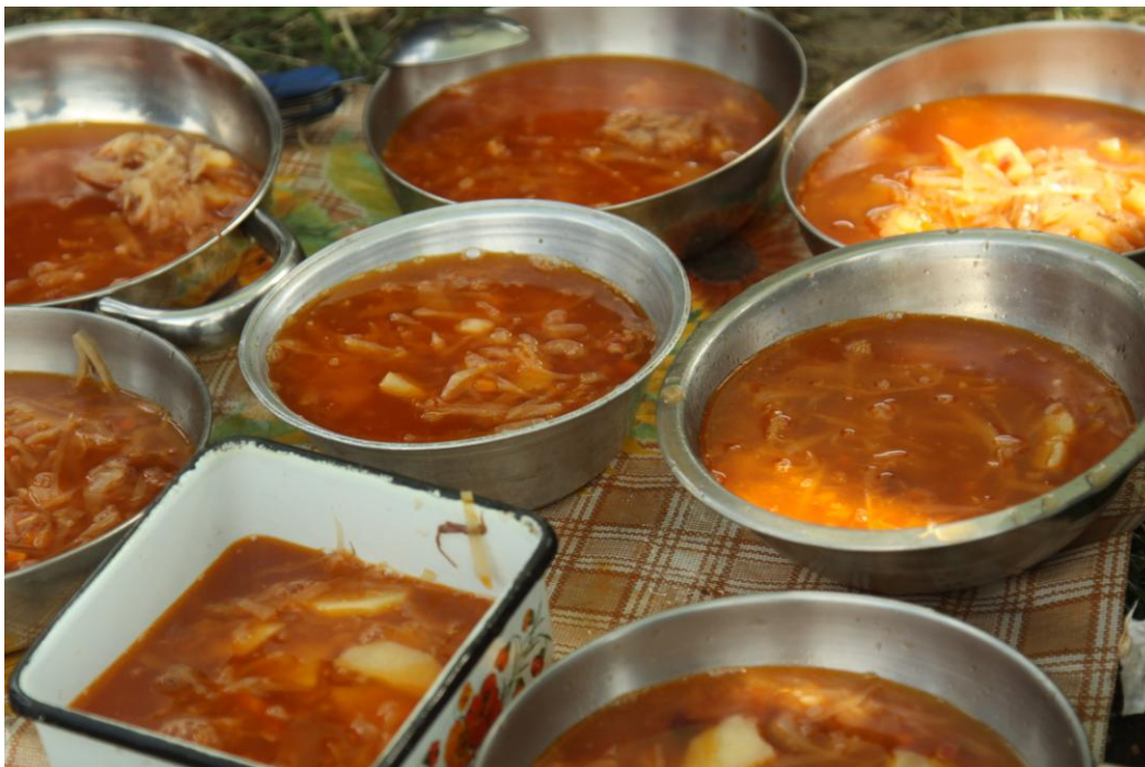
Фото 13, 14. Борц