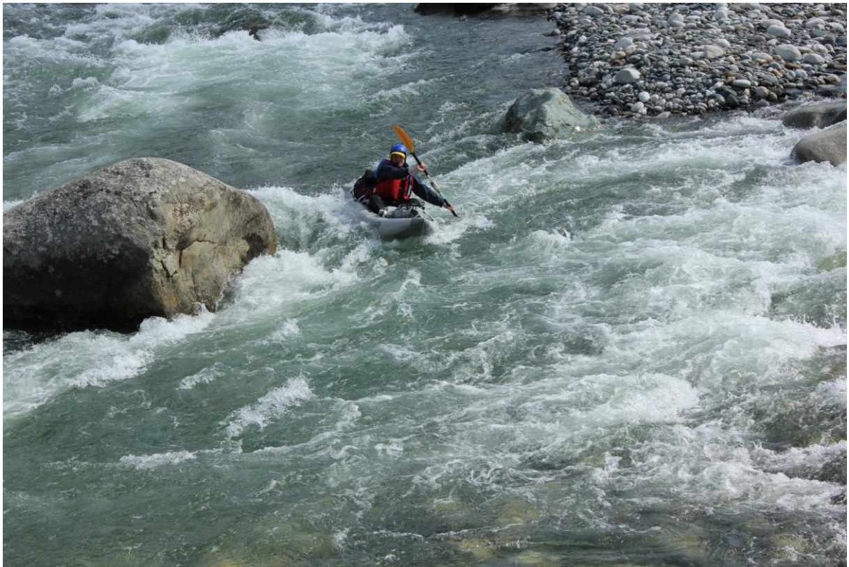
Фото 3, 4. «Лунный Камень», Федор, Каньон Спорт.