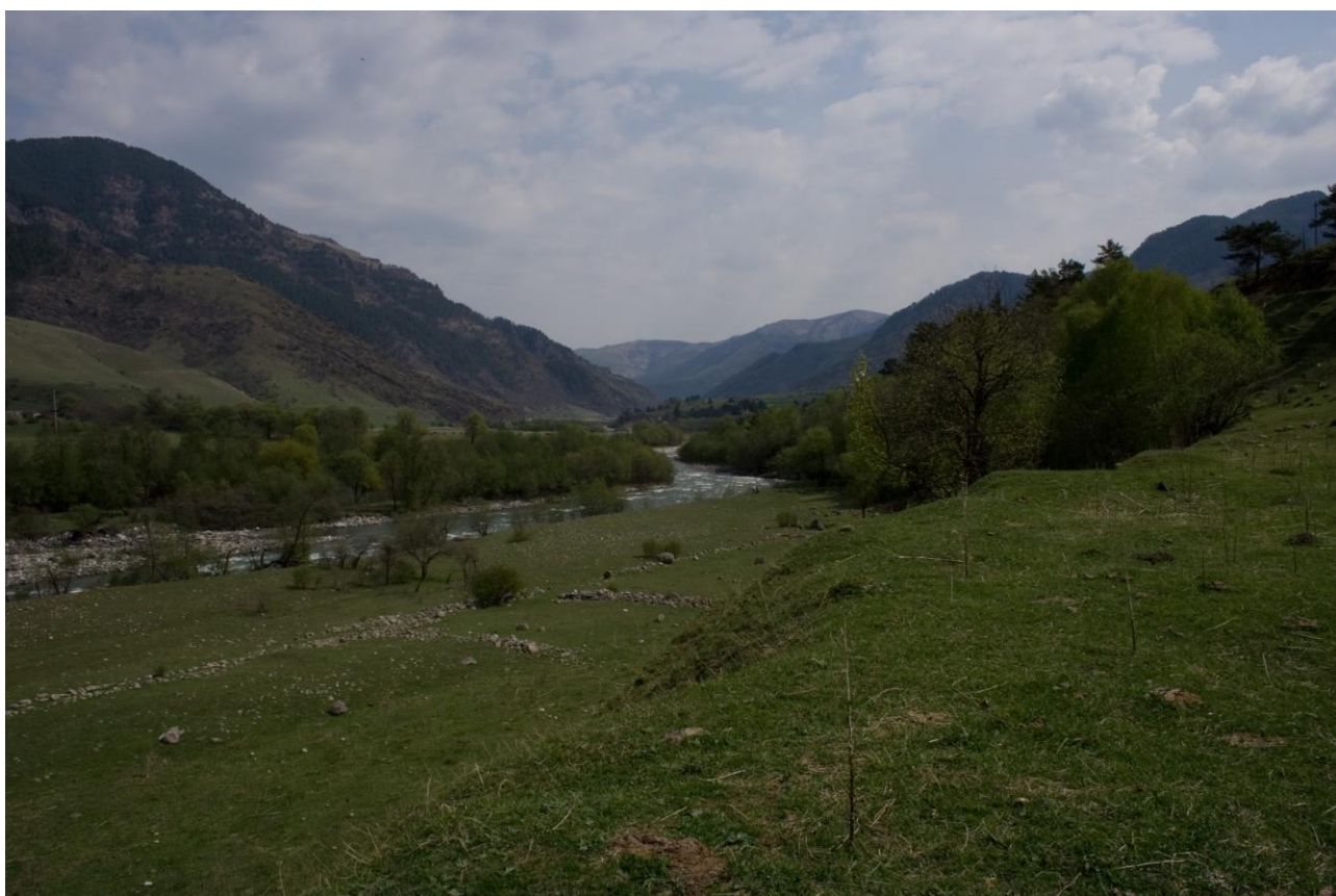
Фото 9,10. Долина р.Теберда